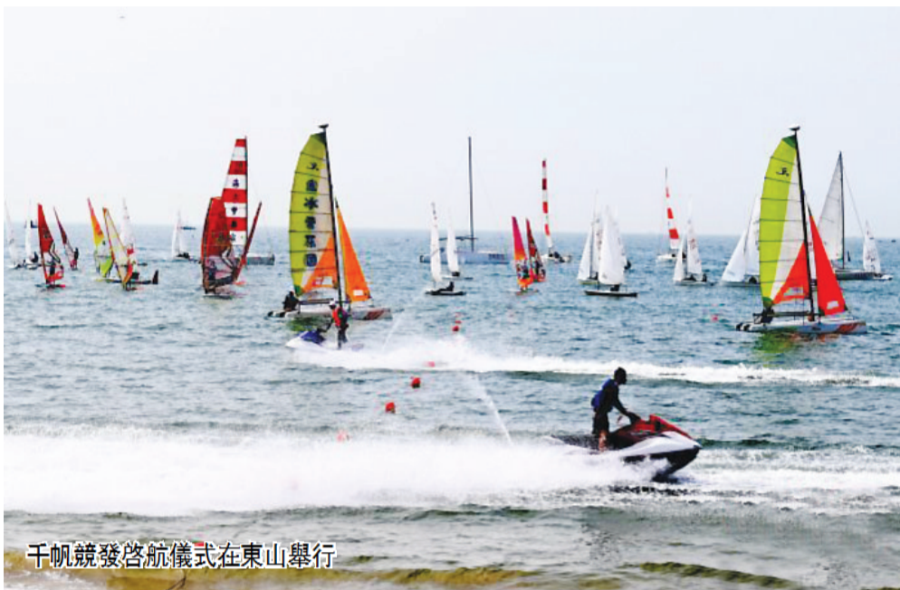
千帆競發啟航儀式在東山舉行

2023年5月19日是第13個“中國旅遊日”，今年的活動主題為“美好中國，幸福旅程”。福建分會場主題活動由福建省文化和旅游廳、漳州市人民政府主辦。每年的“中國旅遊日”都是一場盛大的文惠惠民嘉年華。其中，福州舉行2023年“5·19中國旅遊日”福州分會場活動；廈門舉辦“最美廈門文旅人”徵集遴選；漳州啟動“文創讓生活更美好”文創大賽；泉州開啟“最向往，‘購’閩南”美好生活狂歡節；三明舉行“中國綠都·最氧三明四季行”明溪觀鳥露營節；莆田舉辦“莆陽爽夏·暢游莆田”全國重點旅行社踩線活動；南平推出“山盟海誓”旅遊產品發布暨浙皖閩贛國家生態旅遊協作區旅遊推介